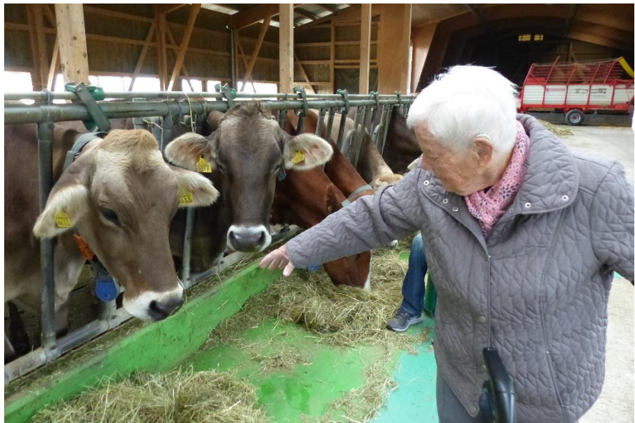
Bauernhof Bord, Kerns

Wir sind seit über einem Jahr Mitglied einer vorteilhaften Einkaufsgemeinschaft und können in allen Bereichen, von Pflegeprodukten über Unterhaltsleistungen bis hin zu Lebensmitteln, von sehr attraktiven Konditionen profitieren. Die Investition in unsere gut ausgebaute Photovoltaikanlage zahlt sich über die Jahre aus und trägt zur Dämpfung der Energiekosten bei.