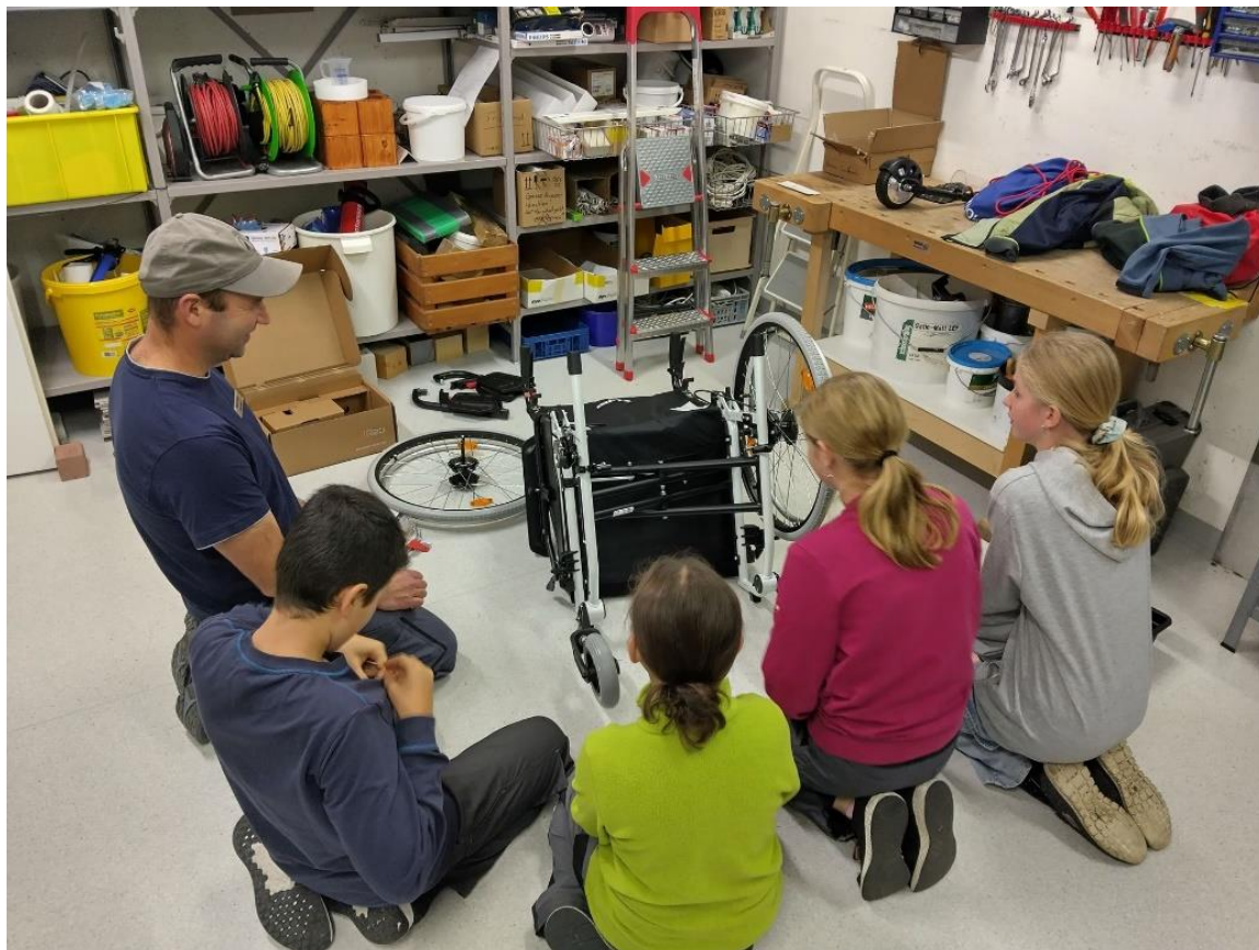
Zusammenbau elektrischer Rollstuhl am Zukunftstag