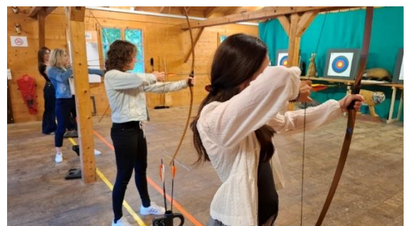
Bogenschiessen am Mitarbeiter- Event im Melchtal